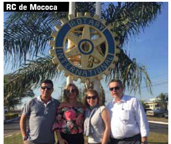
RC de Mococa