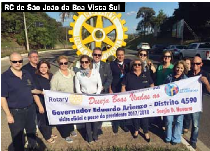
RC de São João da Boa Vista Sul