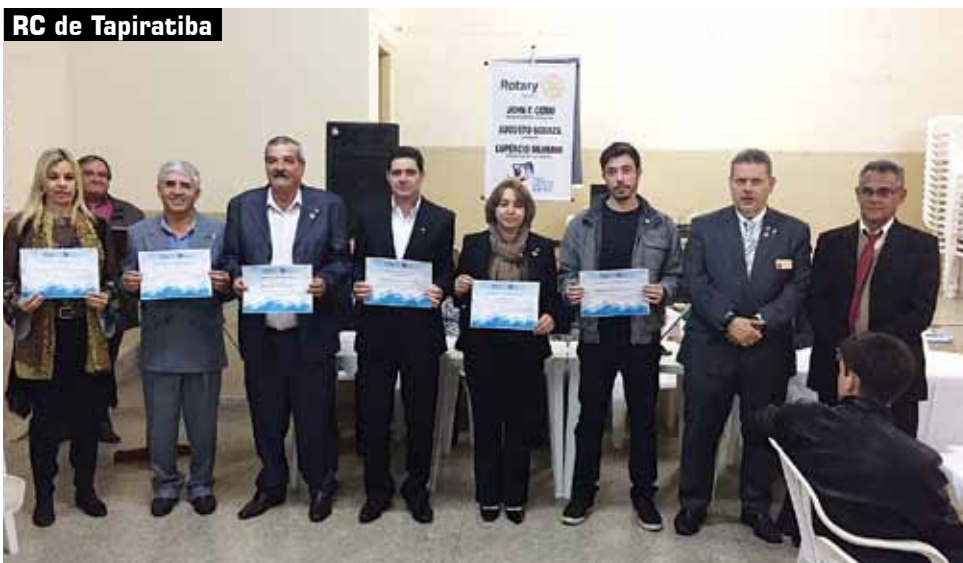
RC de Tapiratiba