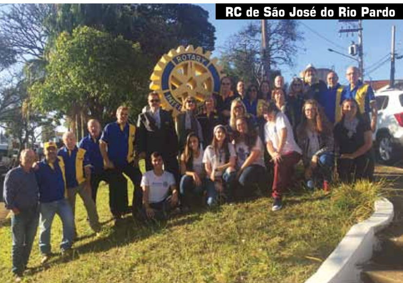
RC de São José do Rio Pardo