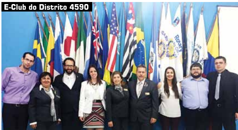
E-Club do Distrito 4590