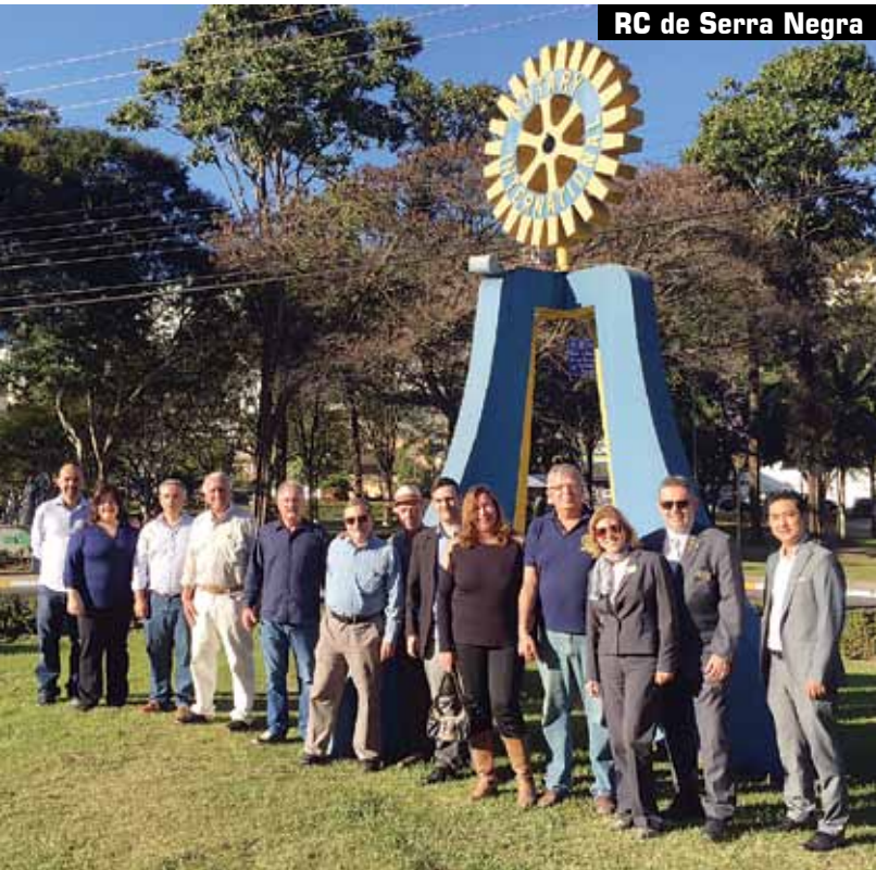
RC de Serra Negra