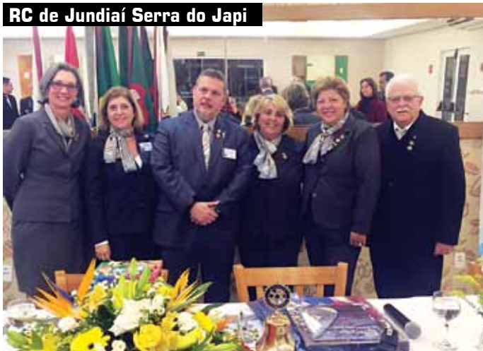
RC de Jundiá Serra do Japi