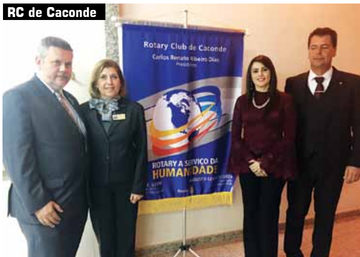
RC de Caconde