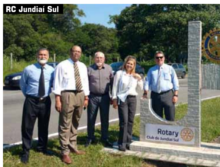
RC Jundiaí Sul