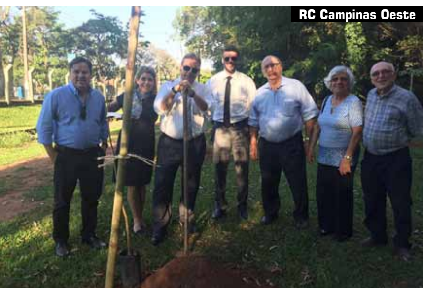
RC Campinas Oeste