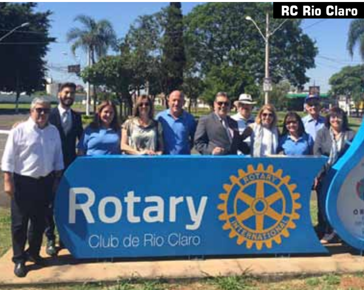
RC Rio Claro