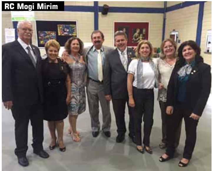
RC Mogi Mirim