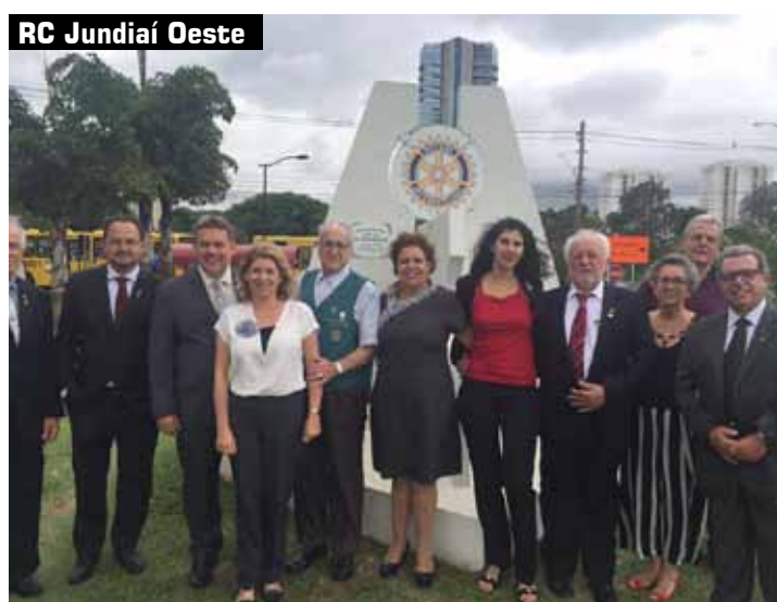
RC Jundiaí Oeste