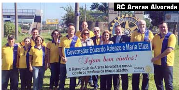
RC Araras Alvorada

festiva comemorativa aos 24 anos de fundação do clube com a presença de muitos companheiros dos demais clubes da cidade. Em Jaguariúna, a assembleia foi realizada na sede da AJJA, Assoc. Jaguariunense de Jovens Aprendizes, um dos maiores serviços prestados pelo Rotary lá. Outra visita importante foi ao recém-criado Rotary Club de Artur Nogueira. Muitas informações foram passadas com o objetivo de fortalecer o Club e sua participação no Distrito.