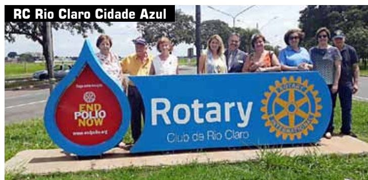
RC Rio Claro Cidade Azul