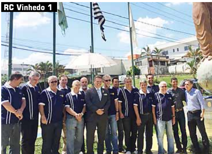
RC Vinhedo 1