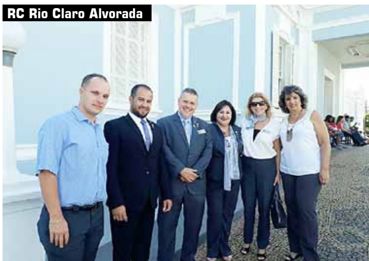
RC Rio Claro Alvorada